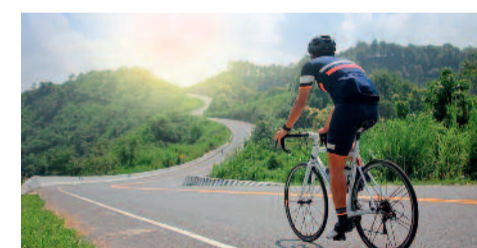
साइकिलिंग करने से पहले सबसे पहले जो डिसाइड करना है, वो है गोल यानी लक्ष्य। गोल डिसाइड करने से फोकस और एनर्जेटिक रहने में मदद मिलेगी। लेकिन ध्यान रखें, शुरुआत में छोटे गोल ही रखें। ऐसा नहीं होना चाहिए, कि पहले ही दिन आप खुद को 10 किलोमीटर साइकिलिंग का टारगेट दे दें। जो कि काफी मुश्किल होगा। ऐसा करने से आप डिमोटिवेट हो जाएंगे। बल्कि रोजाना थोड़ी-थोड़ी दूरी बढ़ाते हुए बड़े गोल तक पहुंचें। विशेषज्ञों का सुझाव है कि बार-बार छोटे ट्रेनिंग सेशन करना, लंबे सेशन की तुलना में अधिक प्रभावी होते हैं।

किसी को पहाड़ी वाली जगह पसंद होती है, तो किसी को मॉल्स और मार्केट घूमना पसंद होता है। अब सोचिए, जिसे पहाड़ी एरिया में घूमना पसंद है उसे मॉल में ले जाकर घूमने को बोला जाए तो उसे कैसा लगेगा ? वो मॉल में घूम तो लेगा, लेकिन एंजॉय नहीं कर पाएगा। ऐसा ही साइकिलिंग करते समय भी होता है। अगर आप साइकिलिंग करने के अधिक फायदे लेना चाहते हैं तो अपनी पसंदीदा जगह चुनें। जैसे, रोड, घाटी वाला एरिया, नदी किनारे, कॉलोनी, इनडोर आदि। अगर आप अपनी पसंदीदा जगह पर साइकिलिंग करने जाते हैं, तो उसके अधिक बेनिफिट ले पाएंगे।