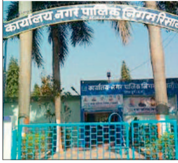
रिसाली को लिखा है। उन्होंने लिखा कि नगर पालिका निगम रिसाली के सभी 40 वार्डों के

उनकी इस मांग को देखकर निगम के पार्षद और सभापति व नेता प्रतिपक्ष तक हैरान हैं। उनका कहना है कि इस तरह का प्रस्ताव पूरी तरह से गलत है। महापौर ने 23 फरवरी को इस संबंध में एक पत्र आयुक्त नगर पालिक निगम