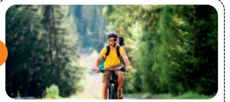
साइकिलिंग करते समय याद रखें ये टिप्स, मिलेंगे अधिक फायदे